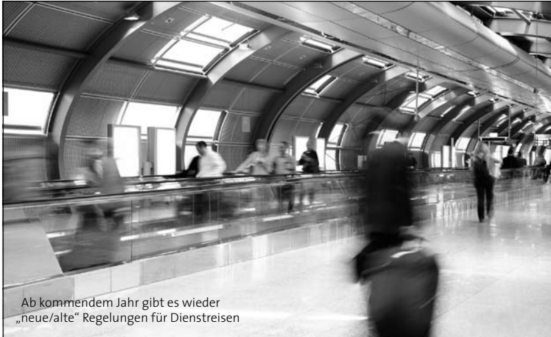
Ab kommendem Jahr gibt es wieder „neue/alte“ Regelungen für Dienstreisen