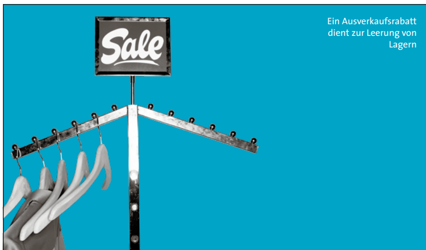
Ein Ausverkaufsrabatt dient zur Leerung von Lagern